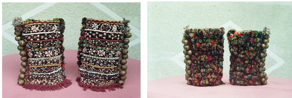
Podoabele de la picioarele junilor – bumbureze , mărgele și ciucuri

Fiecare june, din Ceata Junilor din Gura Râului, „trebuia să-și procure singur peană și podoabe pentru picioare, respectiv mărgelile și bumburezele (zurgălăii)” 7 . Zurgălăii erau cumpărați, în ultima vreme, de la cei care vindeau cădelnițe. Interesant este că, în prima zi a apariției junilor, ei merg la biserică „necusuți”, adică fără bumbureze, ca să nu deranjeze slujba: „în prima zi de Crăciun, dimineța, junii, îmbrăcați în costum național, cu pălăriile cu pene, dar fără podoabele de la picioare, mergeau încolonați la biserică și se așezau în ordine în fața altarului, participând la toată slujba. Apoi, după ieșirea din biserică, îmbrăcau pantalonii (nădragii) tradiționali cu podoabe și toți se întâlneau la gazdă, începând petrecerile de Crăciun” 8 . Care era rolul bumburezelor ? „Ei când săreau, alea făceau o gălăgie mare. Și cred că ăsta era și simbolul lor. Că după cum cânta vioara – că era numa’ vioara, dipla; la noi îi zicea dipla –, după cum mergea melodia diplei, așa făceau ei mișcarea din picioare. Și mișcarea din picioare dădea ritmul ăla, bumburezele alea, după cum era melodia, că erau mai multe feluri de jocuri pe care ei le făceau, junii. S-auzeau și când mergeau prin sat. Mergeau prin sat strigând, aveau strigături din ăștia și țam, țam, țam, țam și bumburezele băteau ca la armată și aveau cadență... lucruri care au apus pentru totdeauna.” (Pr. Ioan Peană, Gura Râului, n. 1945)