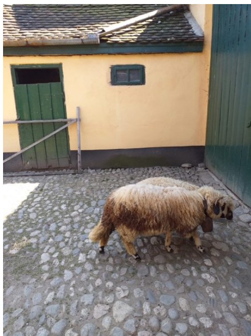
Clopot numit bandă