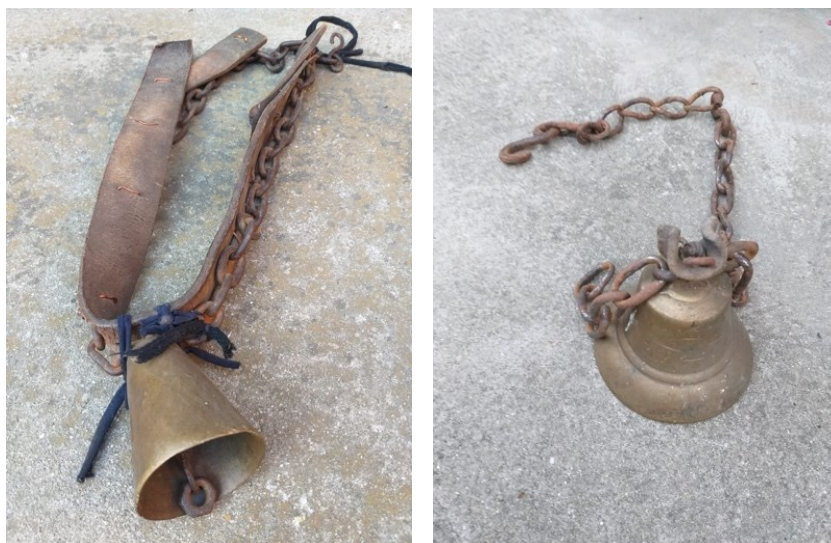
Clopote de cai, de cioaie