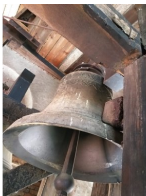
Mecanismul ceasului, ciocanul care bate ora fixă în clopotul mare, ciocanul care bate sferturile în clopotul mijlociu