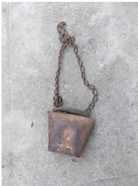
Clopot de vite (în special de bivoli)