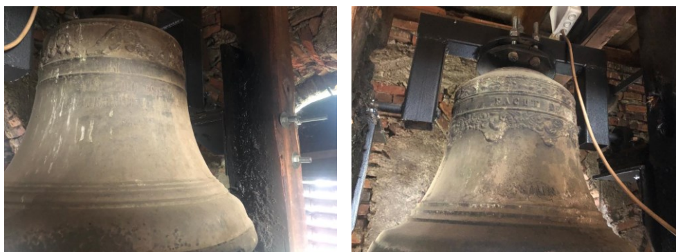
Clopotul mare și clopotul mic de la biserica mică