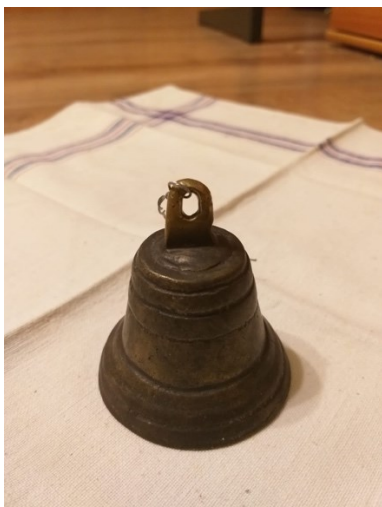
Clopotul școlii (până la început de secol XXI)