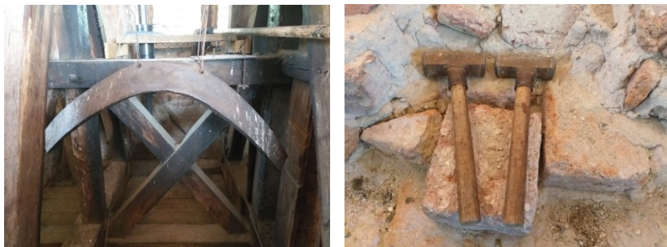
Toaca din metal de la biserica mare și ciocănele pentru toacă

„Chemările toacei sunt glasurile îngerilor.” 24 Originile toacei se regăsesc în Levant și Egipt. „Toaca s-a răspândit cea dintâi în Orientul creștin. După ce tragerea clopotelor a fost interzisă în teritoriile cucerite de musulmani, toaca a cunoscut o mare întrebuințare și răspândire în Bisericile Orientale, precum și în Muntele Athos” 25 (cu toate că, în timpul otomanilor, acesta era singurul loc din imperiu unde se puteau bate clopotele). Toaca și ciocănele ei se pare că își au originea în „folosirea ciocănelelor de lemn cu care se bătea în ușile chiliilor pentru a-i deștepta pe monahi sau pentru a-i chema la rugăciunea de obște” 26 .