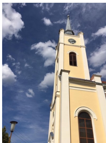
Biserica mică și biserica mare din Gura Râului