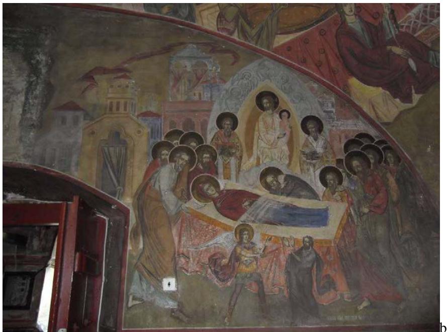
Figura 1. Pictură veche (a – detaliu tablou votiv) și pictură nouă (b). Peretele de vest al pronaosului. Biserica „Sfinții Petru și Pavel” din Prejmer, județul Brașov