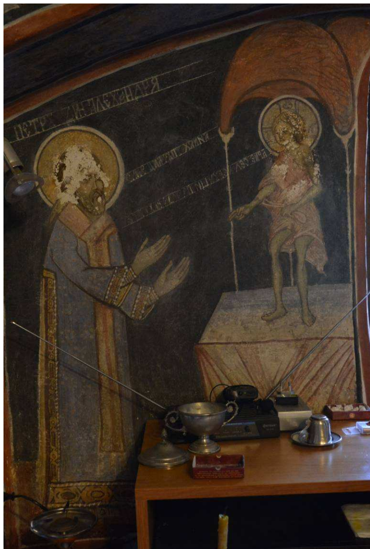
Figura 6. Viziunea lui Petru din Alexandria . Detaliu pictură veche restaurată. Altar. Biserica „Sfinții Arhangheli Mihail și Gavril” din Ocna Sibiului, județul Sibiu