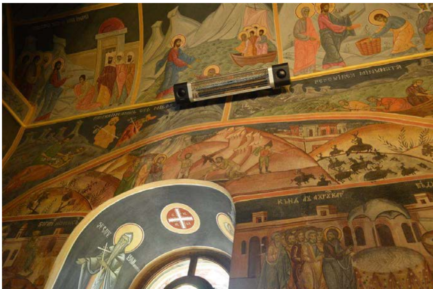
Figura 4. Detaliu pictură peretele de nord al naosului (pictură nouă în partea superioară și pictură veche în partea inferioară). Biserica „Sfinții Arhangheli Mihail și Gavril” din Ocna Sibiului, județul Sibiu