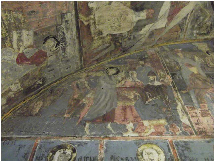
Figura 2. Detaliu pictură naos. Biserica „Sfântul Nicolae” din Sânpetru, județul Brașov