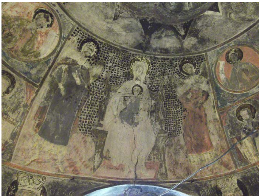
Figura 3. Detaliu pictură altar. Biserica „Sfântul Nicolae” din Sânpetru, județul Brașov