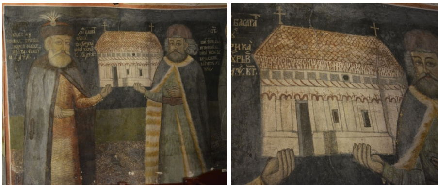
Figura 3. Tabloul votiv din Biserica „Sfinții Arhangheli Mihail și Gavril” din Ocna Sibiului, județul Sibiu. Ansamblu și detaliu (chivot).