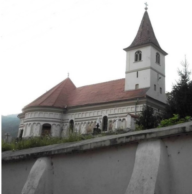
Figura 2. Biserica „Sfântul Nicolae” din Turnu Roșu, județul Sibiu.