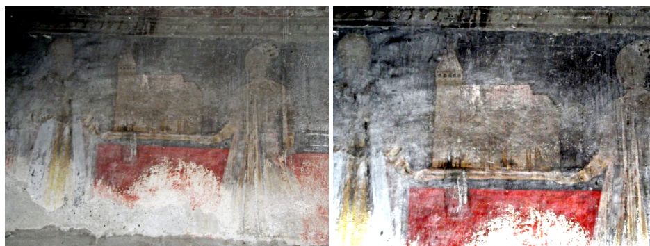
Figura 5. Tabloul votiv din Biserica „Intrarea în Biserică a Maicii Domnului” din Teiuș, județul Alba. Ansamblu și detaliu (chivot).