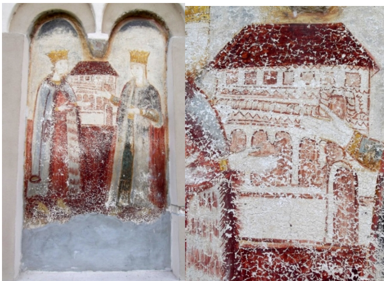
Figura 1. Tabloul votiv din Biserica „Sfântul Nicolae” din Turnu Roșu, județul Sibiu. Ansamblu și detaliu (chivot).