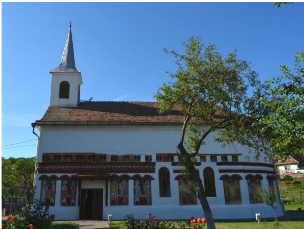
Figura 4. Biserica „Sfinții Arhangheli Mihail și Gavril” din Ocna Sibiului, județul Sibiu.