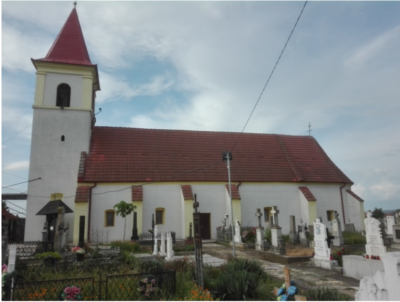
Figura 6. Biserica „Intrarea în Biserică a Maicii Domnului” din Teiuș, județul Alba.