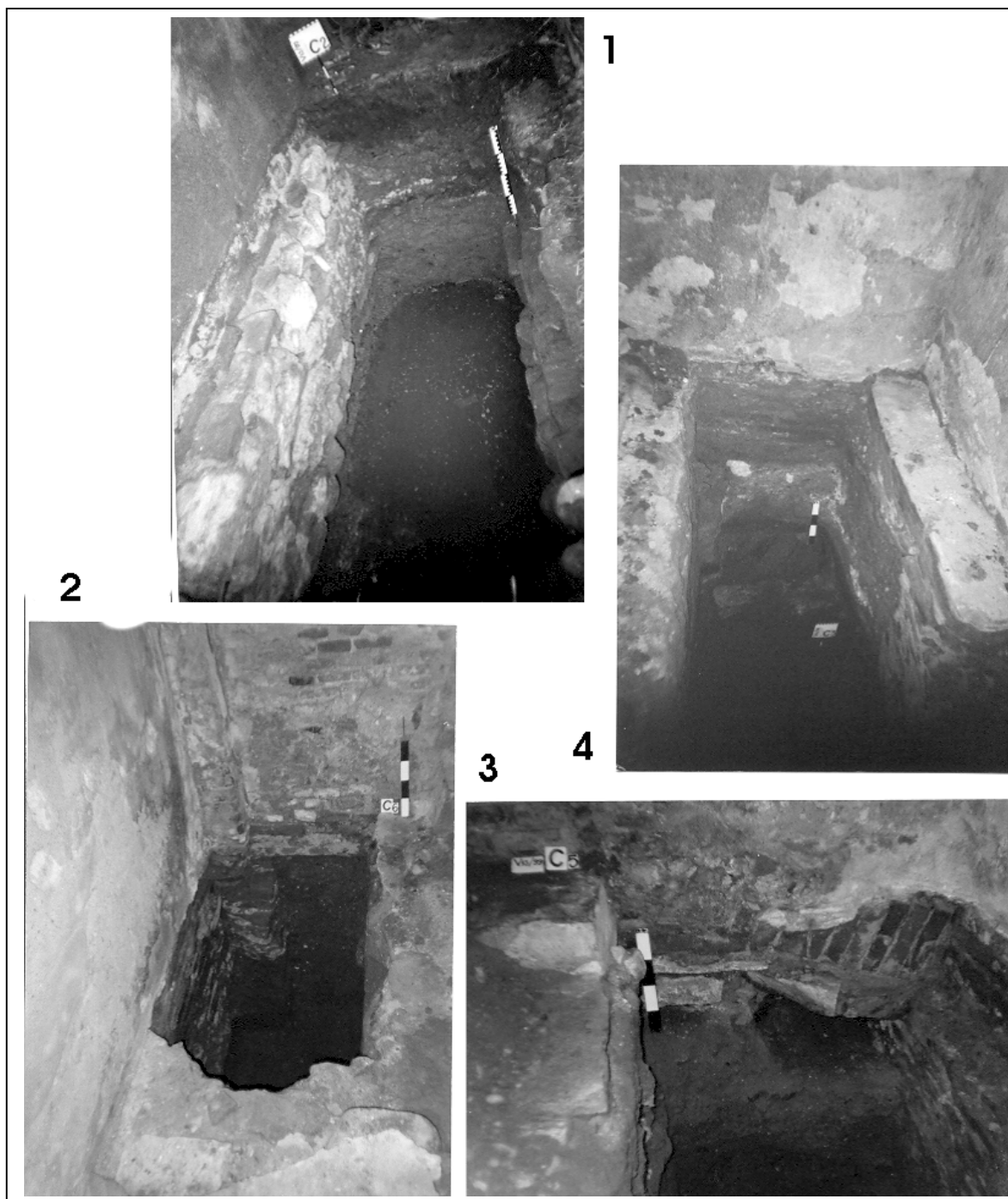
Pl. 5. 1. C2; 2. C3; 3. C6; 4. C5.