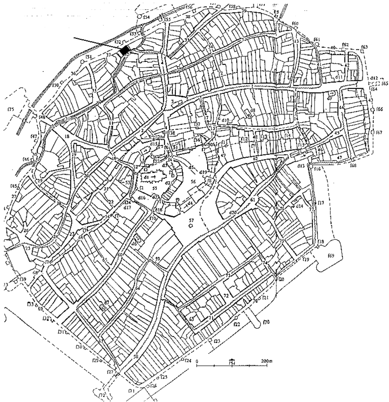
Pl. 1. Sistemul de parcelare al Sibiului istoric în secolul al XIX-lea (după P. Niedermaier) - parcela marcată – casa din str. Vopsitorilor nr. 32.