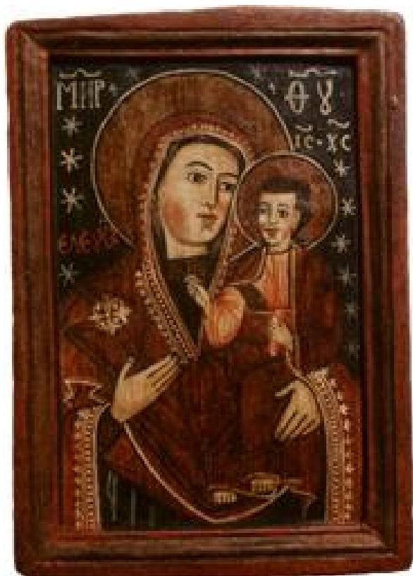
Foto 11. Ansamblu față după restaurare