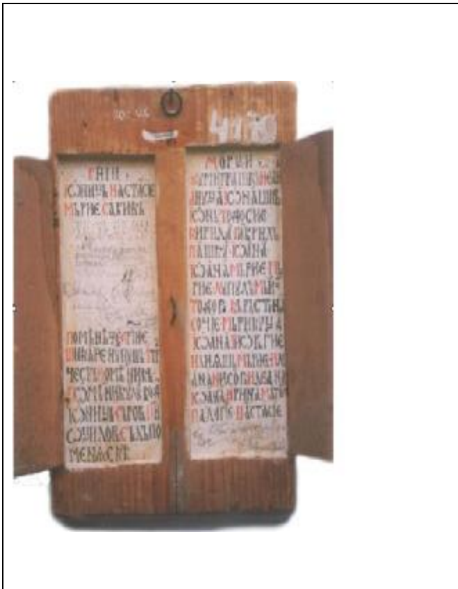
Foto 5. Icoana martor, Arhanghelul Mihail - verso