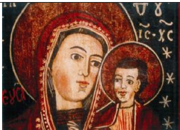
Foto 10. Detaliu față după integrarea cromatică