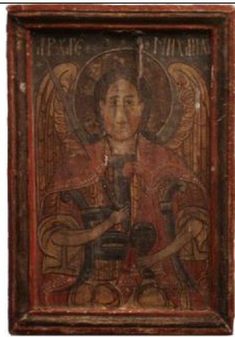
Foto 4. Icoana martor, Arhanghelul Mihail - față