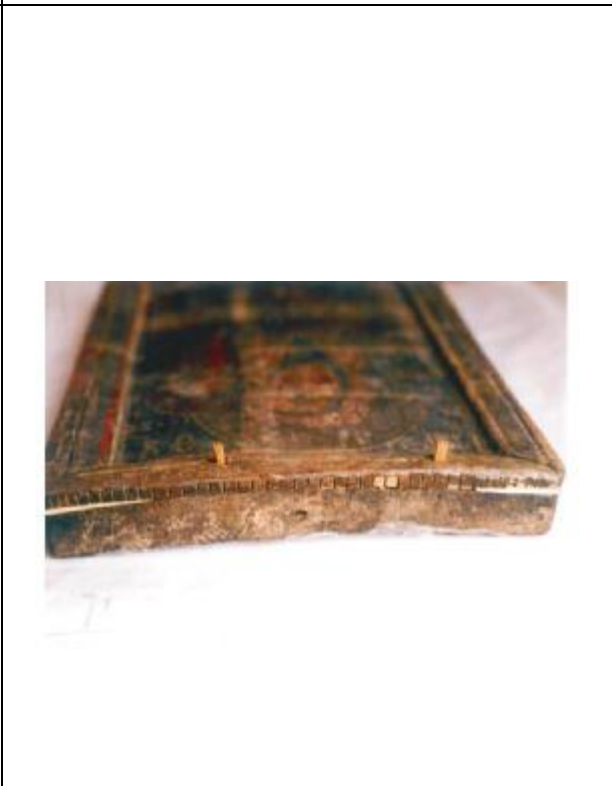
Foto 8. Suplimentarea îmbinării adezive cu ajutorul cuielor