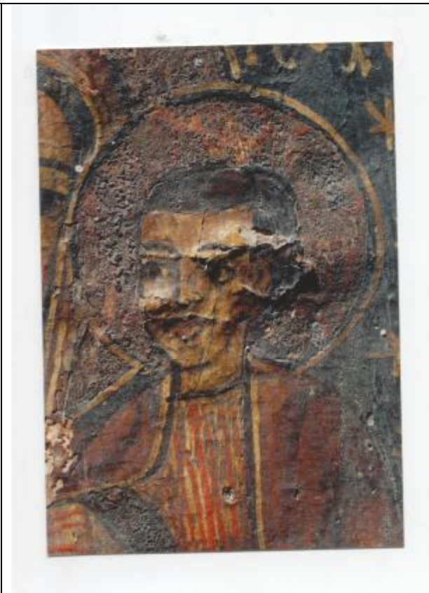
Foto 6. Detaliu față înainte de restaurare