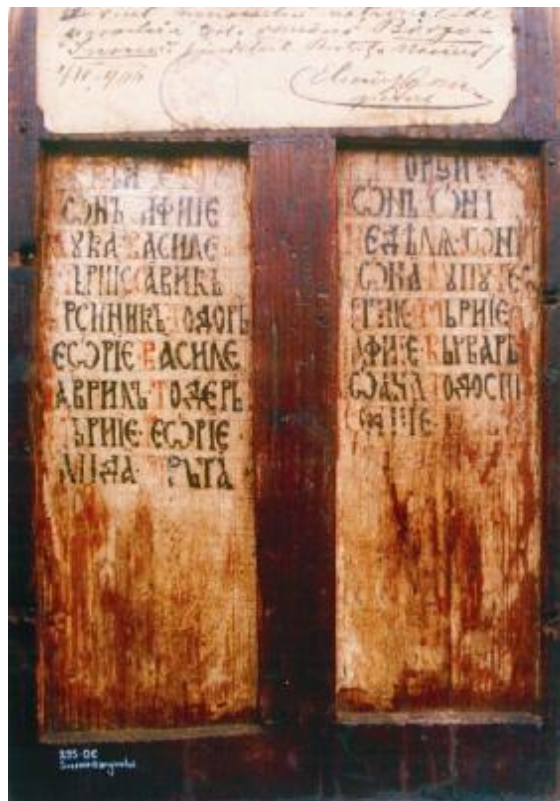
Foto 12. Ansamblu verso după restaurare. Refacerea numărului