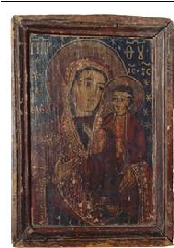
Foto 1. Ansamblu față înainte de restaurare