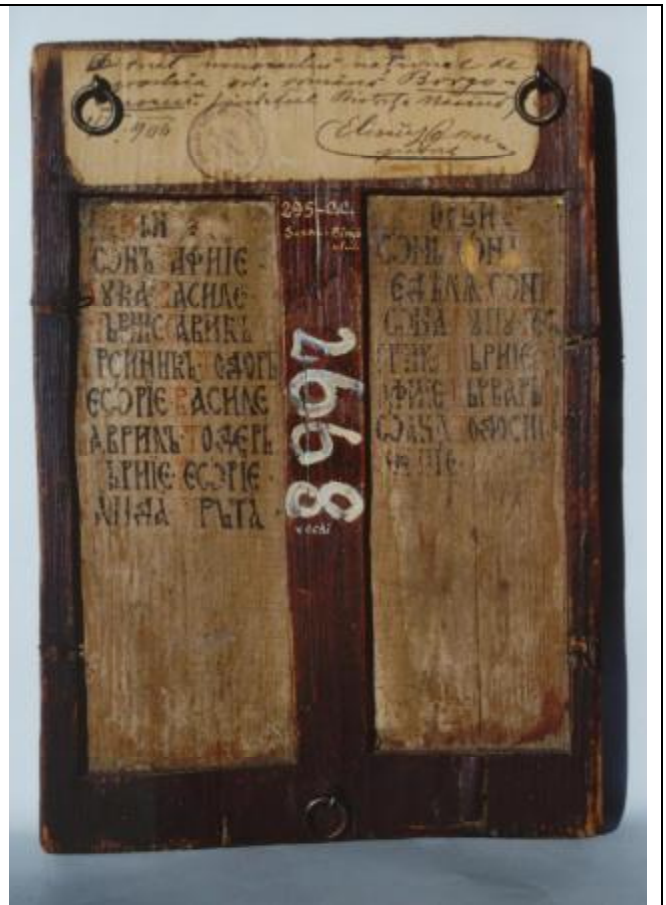
Foto 2. Ansamblu verso înainte de restaurare