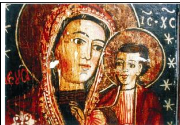
Foto 9. Subțierea selectivă a vernisului