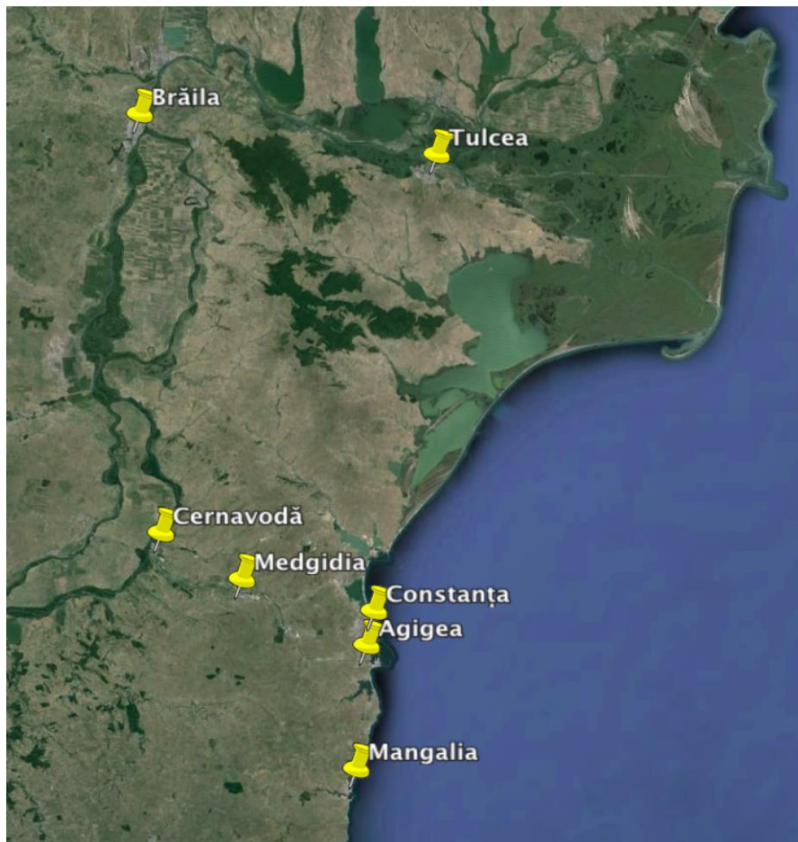
Fig.3. Principalele centre urbane locuite de etnicii turci și tătari în perioada comunistă (Google Earth, 2013).

1878 – 48.784 turci, 71.146 tătari 1948 – 28.782 turci și tătari (recensământul din 1948 nu făcea deosebire între cele două populații) 1956 – 14.329 turci, 20.460 tătari 1966 – 18.040 turci, 22.151 tătari 1977 – 23.422 turci, 23.369 tătari 1992 – 29.832 turci, 24.956 tătari 2002 – 32.098 turci, 23.935 tătari 2011 – 28.226 turci, 20.464 tătari